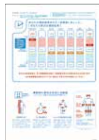
▲重症化予防 受診勧奨案内