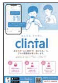
▲Web健康相談窓口 (クリンタル)